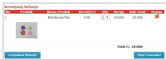
Gambar 9. Tampilan Form Keranjang Belanja