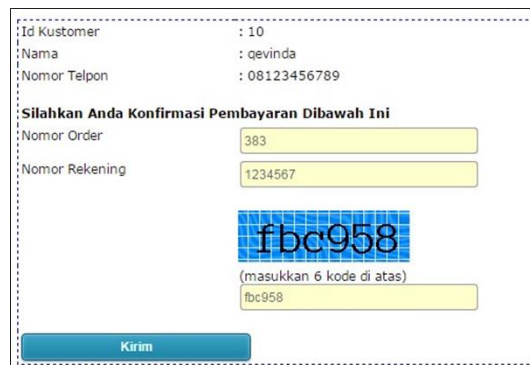
Gambar 21. Tampilan Form Konfirmasi