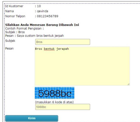
Gambar 10. Tampilan Form Custom Souvenir