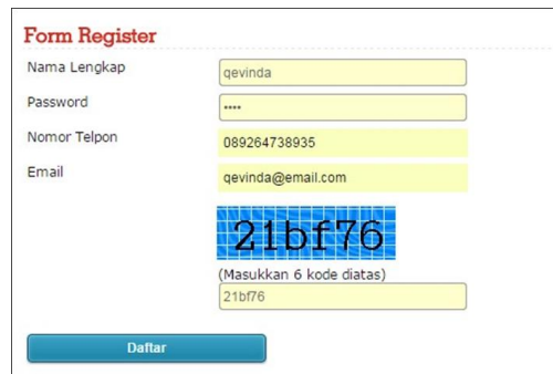
Gambar 7. Tampilan Form Registrasi Customer